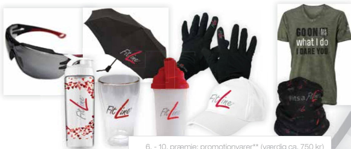
6. - 10. præmie: promotionvarer** (værdig ca. 750 kr)

** Billedeksempel. Præmier kan være andre end de viste