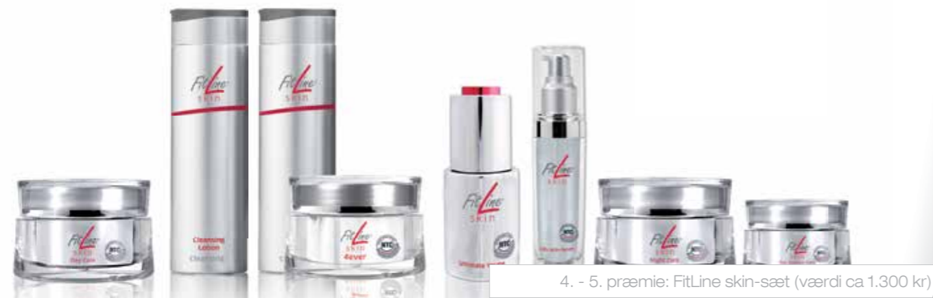
4. - 5. præmie: FitLine skin-sæt (værdi ca 1.300 kr)